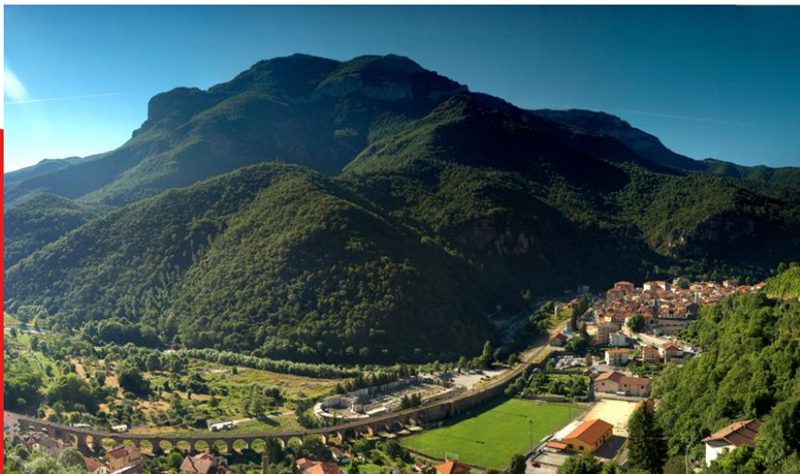
Ormea, 716 m slm