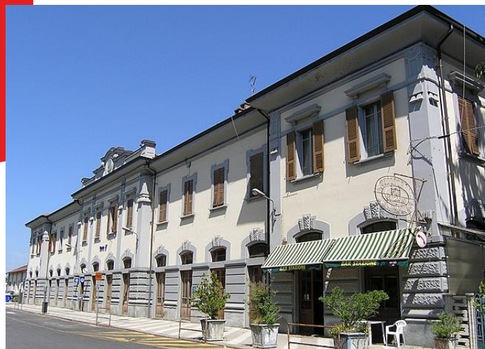
Ceva, stazione attiva dal 1874 387 m slm