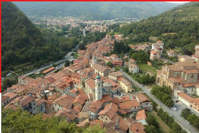
Garessio, 585 m slm